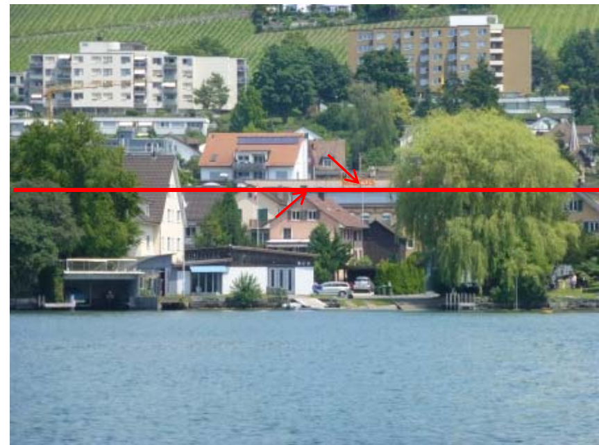
250 Meter 1

*Das Clubhaus des RCE liegt etwa 100 Meter zurückversetzt in einer Bucht. Zieht man eine gerade Verbindungslinie vom Strandbad Heslibach zur Kirche Erlenbach bei 150 Meter, ist man auf der Höhe des RCEs 250 Meter vom Ufer entfernt.